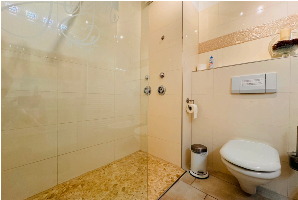
Bad mit ebenerdiger Dusche