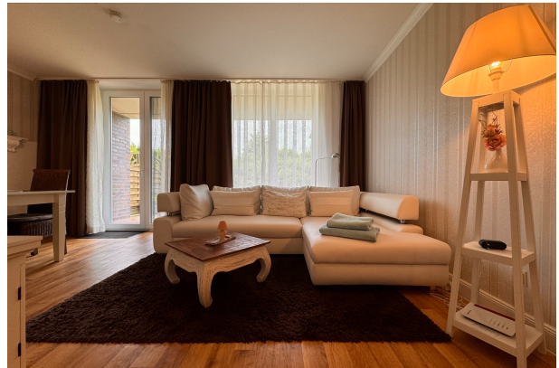
Wohnzimmer mit Schlafcouch