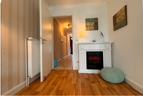
Blick von der Couch