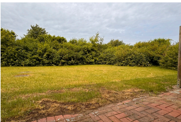
Blick ins Grün